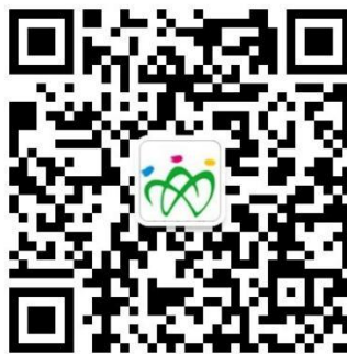
图 4：“山东就业创业导航”微信平台二维码

（一）登录。用人单位、学生扫描“山东就业创业导航”微信平台二维码（图 4）进行登录。“山东就业创业导航”微信平台对全省师范类学生（不含省属师范生）提供双选会服务。