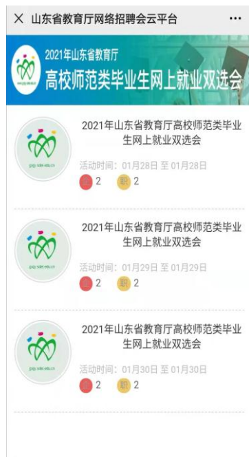
图 6：网上就业双选会首页面

（二）学生投递简历。 访问“山东就业创业导航”中的网上就业双选会栏目（图 5、6），查询用人单位发布的职位，并向意向单位投送简历。