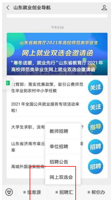
图 5：山东就业创业导航