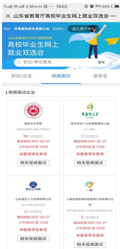
图 7：视频面试单位列表

为达到较好的面试效果，视频面试前，请确保电脑、手机、iPad 等设备网络畅通。有完好的摄像头和音频设备。请尽量选择清晰整洁的背景，避免面试过程中泄露隐私。